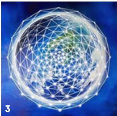
Het lichtnetwerk van driehoeken dat de aarde omspant.