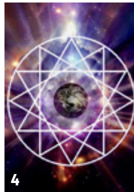
De geometrische twaalfvorm.