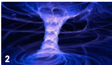
< De omlaagstromende energie in groepsmeditaties.